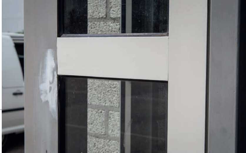
▲ Het resultaat: witte zelfklevende coating geplakt op beschadigde aluminium kozijnen.

► De focus ligt op de toepassing op aluminium en kunststof gevelelementen, maar het unieke van Coatcontrol is dat het ook toepasbaar is op houten ondergronden.