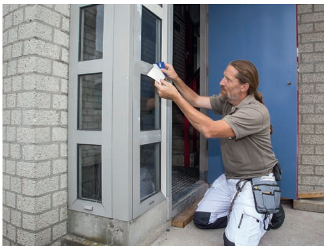
▲ Coatcontrol laat zich iets stugger verwerken dan een reguliere façade film van pvc.

immers een industrieel proces onder geconditioneerde omstandigheden - kunnen heel andere bindmiddelcombinaties worden gebruikt. Visker: "Daardoor kunnen we een industriële, high performance coating produceren; flexibel en met een veel langere levensduur dan de traditionele kwastverf. Zelfs extreem duurzaam, tot